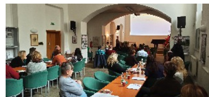
Seminář - Velká novela zákoníku práce - konečná podoba