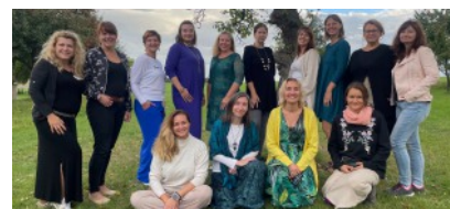
Setkání klubu podnikavých žen při OHK