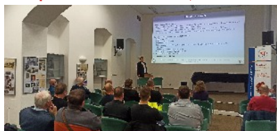
Seminář - Nová legislativa pro oblast vyhrazených elektrických zařízení

6 odborných seminářů s průměrnou návštěvností 23 osob. Vstup - členové 500 Kč, nečlenové 1 000 Kč.