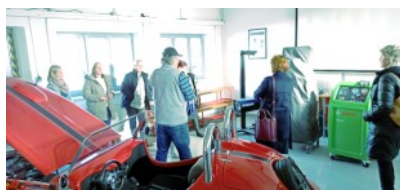
Setkání klubu personalistů v ISŠ Slavkov